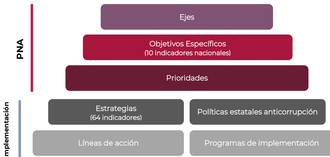
Diagrama 2. Indicadores asociados al SiSE

Los indicadores del SiSE serán complementarios entre sí, es decir, se conectarán armónicamente unos con otros. Ello quiere decir que cada uno aportará valoraciones distintas de un mismo tema estratégico o problemática. Por ello, deberán ser vistos como métricas dependientes entre sí, que permitirán dar cuenta integral del avance de los temas principales para el SNA.